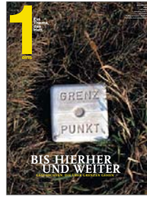
„Ein“ - das Abschlussmagazin der 40. Lehrredaktion befasste sich vor dem Hintergrund der EU-Ost-Erweiterung mit Grenzgingen und Grenzerfahrungen.

Bis zur Reform des Journalistik-Studiums wählte die Journalistenschule jedes Jahr dreißig Bewerber für „Studentenklassen“ aus, die während des Semesters am Institut studierten und in den Ferien Unterricht an der Schule erhielten. Das Studium bestritten sie mit dreißig weiteren Studenten, die bereits mindestens ein Jahr in einer Redaktion volontiert hatten. Zwar hatten auch die Volontärsstudenten bis zur Diplomprüfung noch zahlreiche Praktika zu absolvieren, darum kümmerte sich aber das institutseigene Praxisreferat.