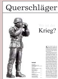
„Querschläger“ - das Dossier der 41. Lehrredaktion der Deutschen Journalistenschule zeigte aktuell zum Irakkrieg Aspekte des Kriegs im Alltag auf.

Im Oktober 1973 nahmen die ersten 15 Diplomstudenten das Studium der Journalistik in München auf. Sie beschränkten damit einen Ausbildungsweg, den es bisher in Deutschland noch nicht gegeben hatte – die Verzahnung von Theorie und Praxis in der akademischen Journalisten- ausbildung. Der Ruf nach Standards in der Berufsqualifikation von Journalisten war sowohl auf fachlicher als auch auf gesellschaftlicher Ebene schon lange laut geworden, vor allem mit Blick auf innere Pressefreiheit und journalistische Ethik.